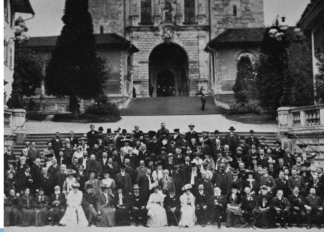
Fototermin. Teilnehmende des 14. Weltfriedenskongresses von 1905 in Luzern auf der Treppe vor der Hofkirche.

Zu den konkreten Resultaten des Kongresses zählte das neue Friedensmuseum, das 1910 eröffnet werden konnte. Man fand im polnischen Grafen Gurowski einen Mäzen, der eine grosse Summe für ein Kriegs- und Friedensmuseum einzuschliessen versprach. Dem Grafen wurde mit stehenden Ovationen am Friedenskongress durch das Luzerner Publikum gedankt. Er erwies sich jedoch als nicht zahlungsfähig,