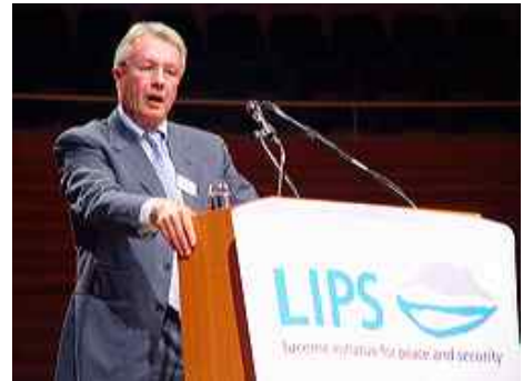
Botschafter Urs Ziswiler teilte in der Eröffnungsrede seine Visionen zu Frieden und Sicherheit mit dem Luzerner Publikum.

Im Gebäude der LZ-Medien (Neue Luzerner Zeitung) stellten sich die Teilnehmer die Frage: „Die Medien – Bote, Bollwerk, Brandstifter?“ Die meisten Medien bemühen sich redlich